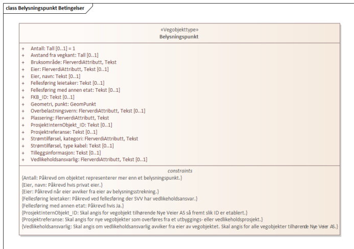
Figur 1:UML-skjema med betingelser