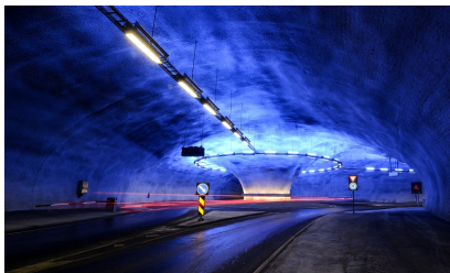
Lyssetting i Vallaviktunnelen.

Bildet viser eksempel på en moderne og litt spektakulær lyssetting i en rundkjøring i Vallaviktunnelen. For å kunne skille ut effektbelysning kan det være lurt å registrere noen av de opsjonelle egenskapene som Fargetemperatur