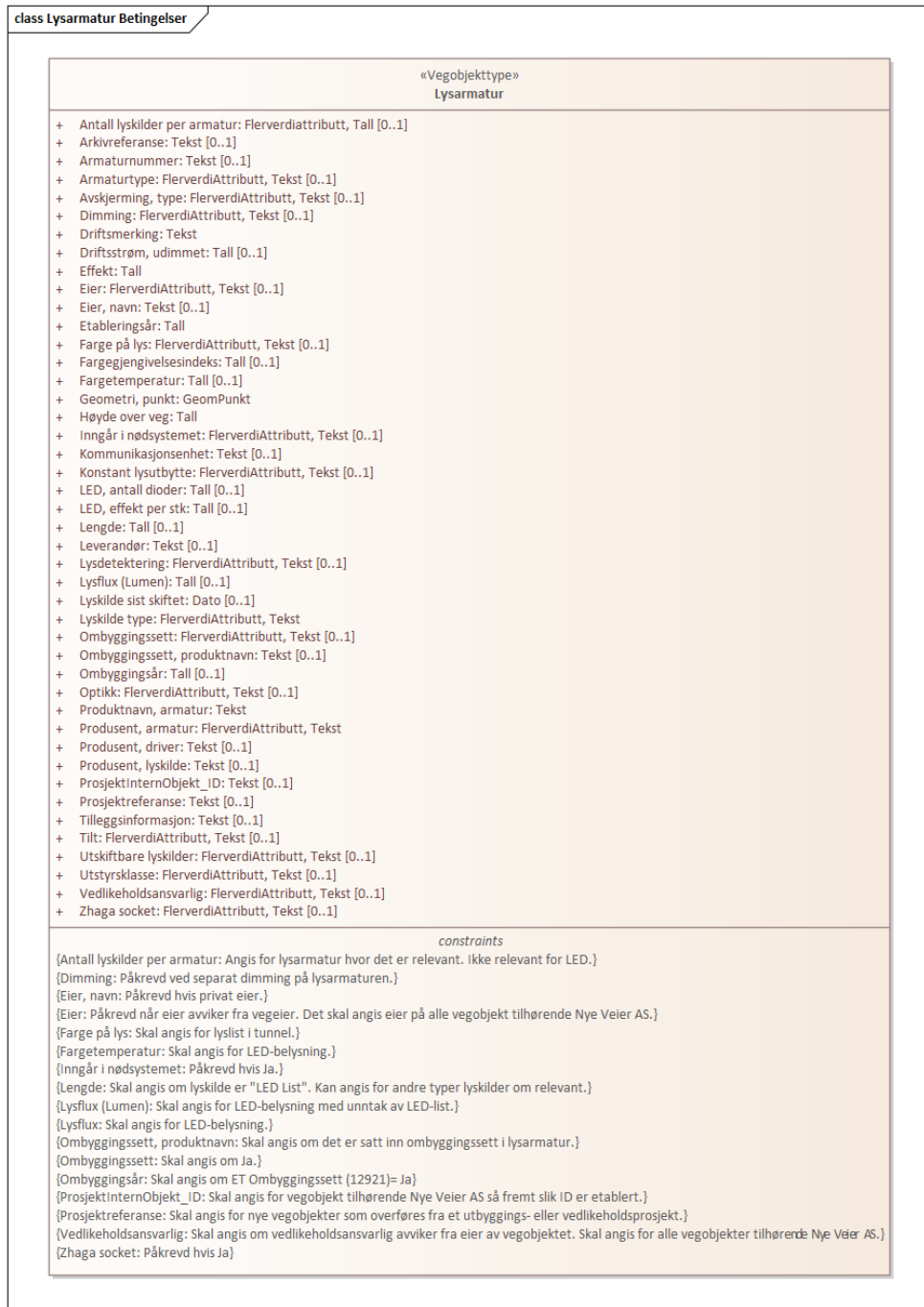
Figur 1: UML-skjema med betingelser