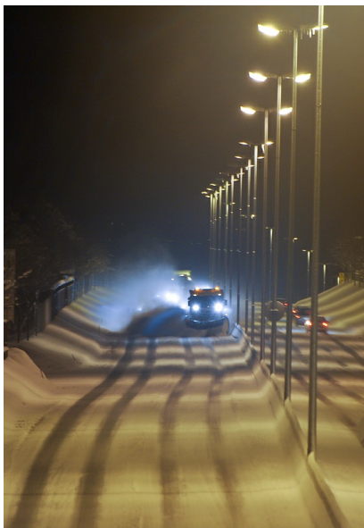
Lyssetting langs midtdeler på omkjøringsveien i Trondheim.

Bildet viser lysmaster med to lysarmaturer i hver mast plassert langs midtdeleren på en firefeltsveg