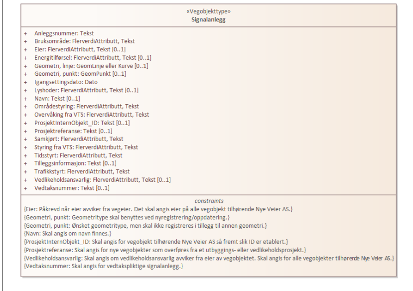
Figur 1: UML-skjema med betingelser