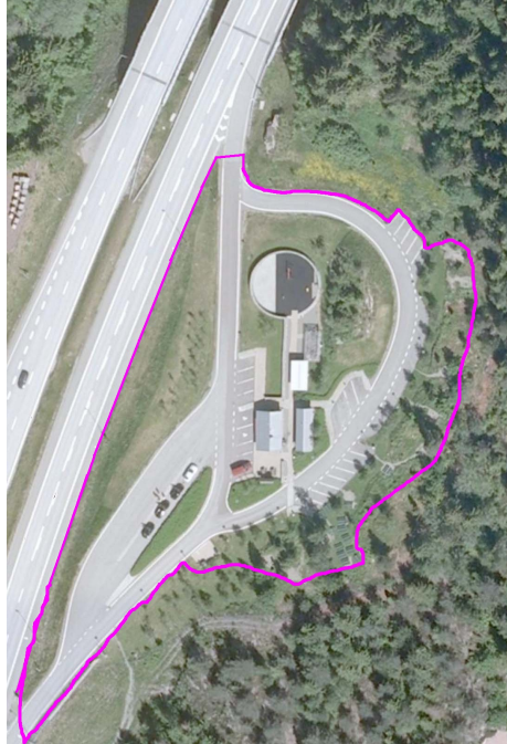
Eksempel på stor rasteplass med adkomst bare fra en kjøreretning

Antall oppstillingspl. Forflytningshemmede 2 Antall oppstillingspl. små kjt. 20 Antall oppstillingspl. store kjt. 8 Areal, belyst 1500 Areal, kjørbart 3000 Areal, totalt 5000 Drikkevann Ja Dusj Nei Eier Fast dekke Ja Kjøretøytype, dimensjonerende Vogntog Lovlig adkomst Høyre Navn Tollerud Strømuttak Nei Type Hovedrasteplass Vedlikeholdsansvarlig Vinterstengning Nei