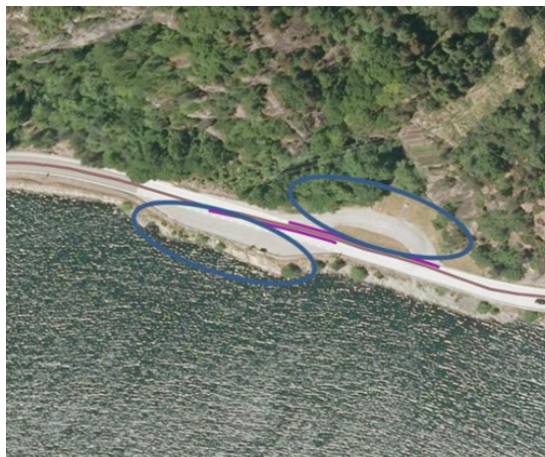
To rasteplasser ved siden av hverandre

Rasteplasser på hver side av vegen med egen innkjøring. Registreres som to rasteplasser