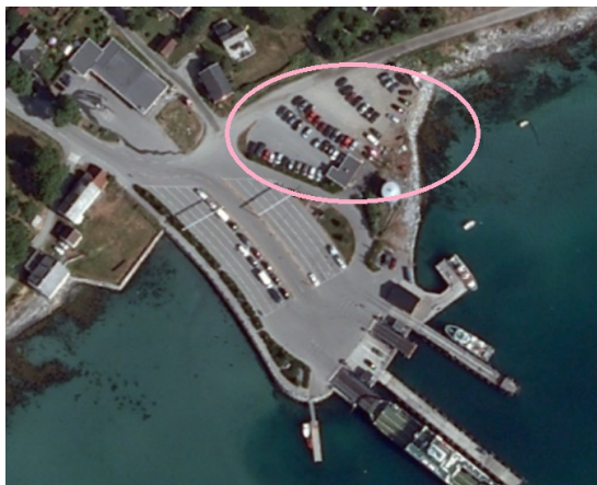
Rasteplass på ferjeleie (Tjøtta i Nordland)

Der dette ikke er tilfelle registreres ikke egen rasteplass og alle datterobjekter registreres som datterobjekter til ferjeleiet.