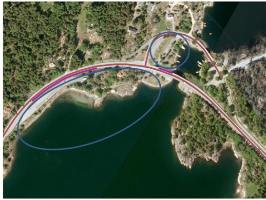
To rasteplasser forbundet med G/S undergang

Hvis disse hadde felles inn- og utkjøring og kjørbær undergang ville de blitt regnet som en rasteplass til tross for lokalisering på begge sider av veien.