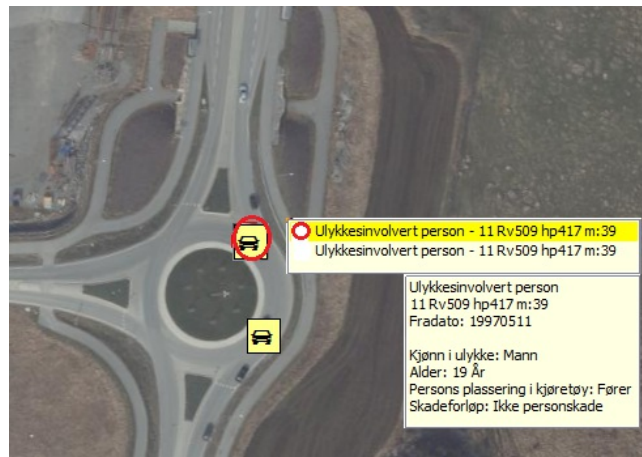
Figur 3: Data for en ulykkesinvolvert person

Her vises data for den ene av to ulykkesinvolverte personer i en ulykkesinvolvert enhet