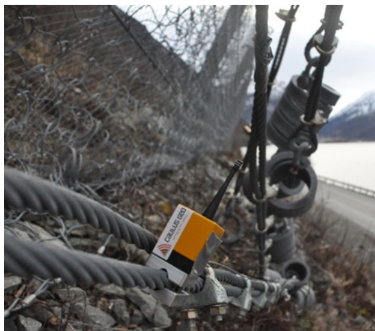
Figur 4: Rystelsesmåling på fanggjerde.

Type naturfare: Steinsprang/skred Overvåkningstype: Rystelsesmåling Varsling på veg: Ingen Adkomst : Kran