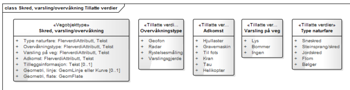
Figur 1: UML-skjema for Skred, varsling/overvåkning