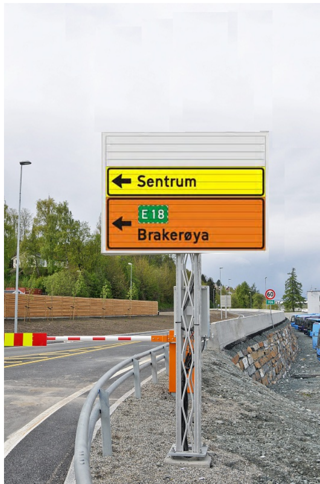
Bildet viser et prismeschild som normalt kan ha inntil 3 budskap. Foto: Knut Opeide og Håndbok V321 (053)

Skiltplate 3 Ansiktsside: Med metreringsretning Antall ansikt: 2 Belyst: Nei Beskrivelse Viser omkjøring til Brakerøya og E18 ved stengt bru Eier: - Fjernstyring: Ja Arkivnummer : 201005382-34 Plasseringkode: 30 Skifting av budskap: Automatisert/Elektrisk Tekst: @711.V90@@723.12@$E18$Brakerøya Type: Mekanisk Variasjon: Et motiv av på Vedtaksnummer: -