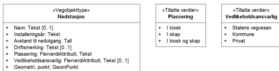
Figur 2: UML-skjema tillatte verdier