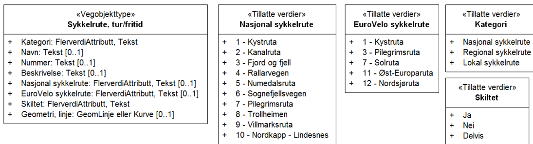
Figur 2: UML-skjema tillatte verdier