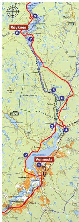
Sykkelrute i Midt-Agder. Kart: Midt-Agder frilutsråd