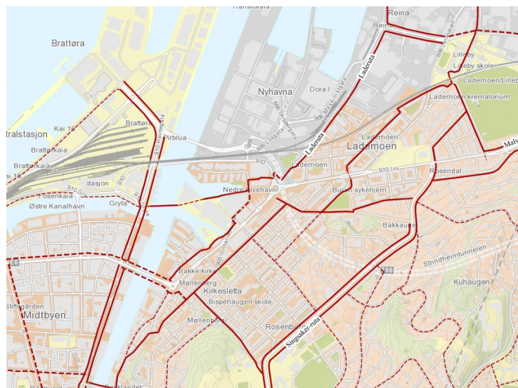
Utsnitt av sykkelruter i Trondheim

En rekke steder i Norge er det utviklet et nett av sykkelruter med tilhørende sykkelkart.