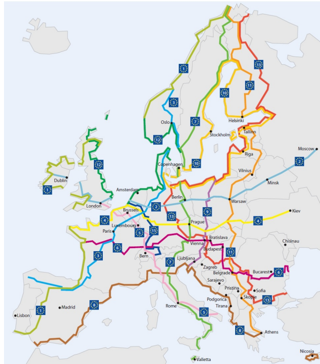
Kart over EuroVelo sykkelruter fra www.eurovelo.org