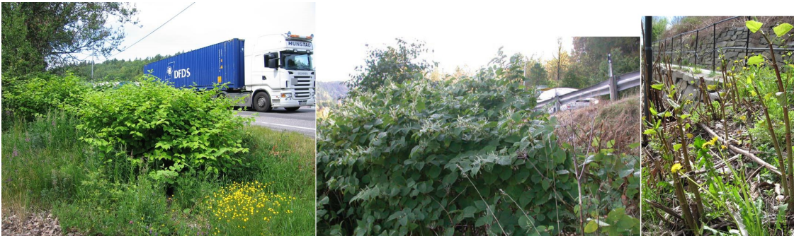
Park- og hybridlirekne.

Park- og hybridlirekne ( Fallopia japonica )