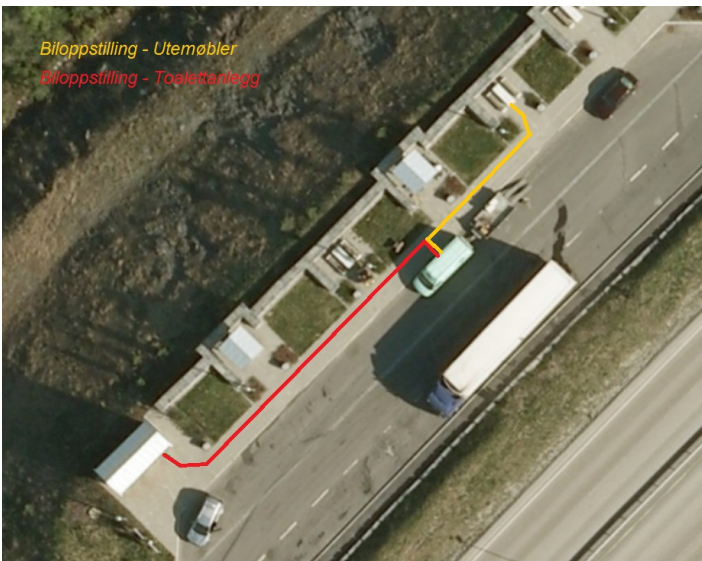
Eksempler på gangadkomster på en nyopprettet rasteplass

Bildet viser eksempel på gangadkomst fra biloppstilling til toalettanlegg og utemøbler på en rasteplass på E6 like sør for Steinkjer.