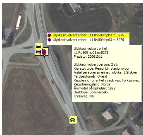
Figur 3: Data for ulykke med 2 ulykkesinvolverte enheter

Eksemplet viser data fra en trafikkulykke med to enheter involvert i ulykken. Vi ser her at det er to personer involvert i den ene bilen, og disse vil da finnes igjen som ulykkesinvolvert person.