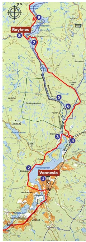
Sykkelrute i Midt-Agder. Kart: Midt-Agder frilutsråd