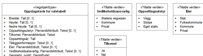
Figur 2: UML-skjema tillatte verdier