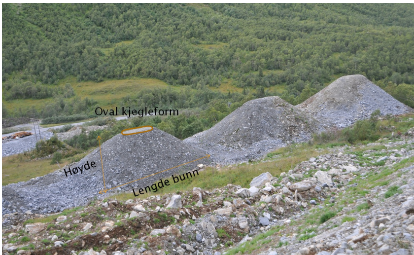
Figur 4: Eksempler på bremseskjegler sett ovenfra.