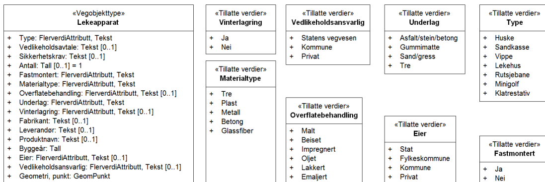
Figur 2: UML-skjema tillatte verdier