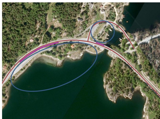
To rasteplasser forbundet med G/S undergang

Hvis disse hadde felles inn- og utkjøring og kjørbar undergang ville de blitt regnet som en rasteplass til tross for lokalisering på begge sider av veggen.