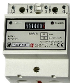
MÅLER MKB363M 3-fas Mekanisk Telleverk 63Amp