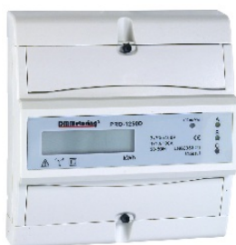
Måler Direkte Digital PRO1250D 3 POL 100A 230V IT