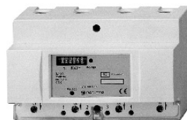
Måler MKD-ITF 463 3 Faser + N Elektronisk Telleverk 63Amp TN Nett