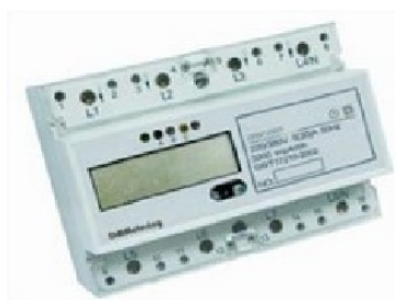
Måler Direkte Digital PRO1250D 3+N 100A 400V TN