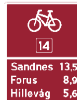
Visningsskilt for sykkelruter, skilt 751, 753, 755, 757