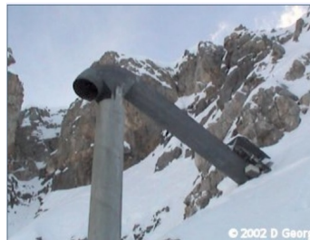
Figur 4: Skredutløsning med GazEx

Adkomst: Helikopter Antall enheter: 1 Byggeår: 2002 Type: GasEx