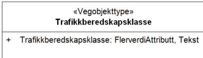
Figur 3: UML-skjema med assosiasjoner