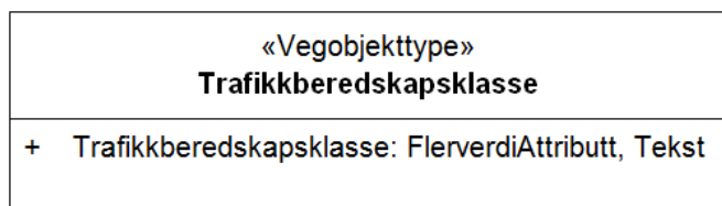
Figur 1:UML-skjema med betingelser