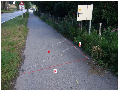
Detektor med induktiv sløyfe for sykkel. Rødt punkt viser hvor geometri skal registreres

Bredde: 1,50 m Bruksområde: Trafikkregistrering, motorkjøretøy Detektornummer: Feltbeskrivelse: sykkel lengde: 1,2 m Type: Induktiv sløyfe,sykkel Skade: ok