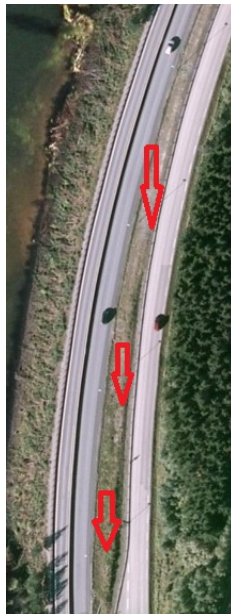
Trafikkdeler mellom hovedveg og lokalveg.

Belegning: Grønt/beplantning Bredde: 9 m Bruksområde: Trafikkdeler hovedveg/lokalveg Lengde: 420 m Møtefri veg: Ja