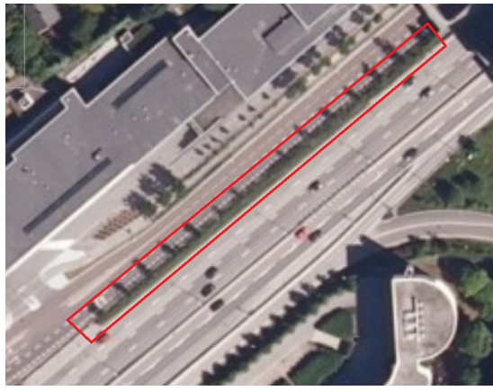
Trafikkdeler mellom paralelle strømmer.