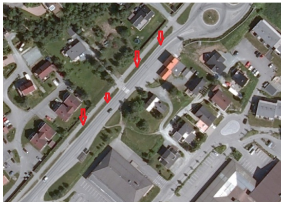
Trafikkdeler mellom lokalveg og gang- og sykkelveg.

Belegning: Grønt/beplantning Bredde: 3 m Bruksområde: Trafikkdeler hovedveg g/s veg Lengde: 12 m