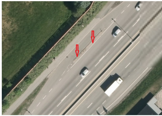
Trafikkdeler på busslomme.

Belegning: Betong Bredde: 1 m Bruksområde: Trafikkdeler på lomme Lengde: 35 m Møtefri veg: Ja