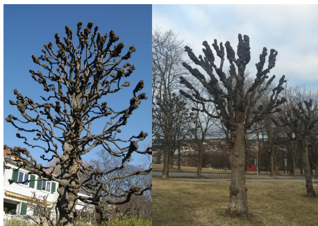
Knutekollede trær.

Antall : 26 Høyde : 7 Krav om ytterligere oppfølging : Ja Krone- og stammestruktur : 2-Middels Kronediameter : 2 Løvfellende/vintergrønne : Løvfellende Plantetidspunkt : 1943 Registreringsdato : 20160312 Stammediameter : 18 cm Treslag, botanisk navn : Tilia cordata Treslag, norsk navn : Lind Type/form : Knutekollet Type/gruppering : Trerekke Utviklingsfase : Vekstfase Eier : Privat Vedlikeholdsansvarlig : Statens vegvesen