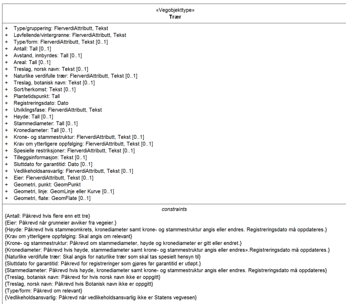
Figur 1: UML-skjema med betingelser