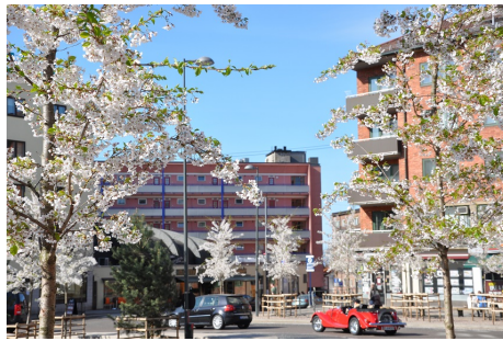
Hegg i blomstring.

Antall : 1 stk Høyde : 4 m Treslag, botanisk navn : Prunus padus Treslag, norsk navn : Hegg Type/gruppering : Frittstående tre Kronediameter : 2 m Løvfellende/vintergrønne : Løvfellende Plantetidspunkt : 2006 Stammediameter : 18 (cm) Eier : Kommune Vedlikeholdsansvarlig : Kommune Krav om ytterligere oppfølging : Ja Krone- og stammestruktur : 2-Middels Registreringsdato : 20150612 Utviklingsfase : Vekstfase