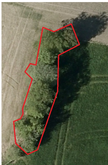
Areal for trær

Areal beregnes ved å lage et polygon, en sirkel eller en oval som omtrent dekker ytterkant av trekronene.