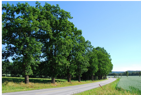
Ensidig allé.

Antall : 40 Høyde : 12 m Areal : 800 m 2 Treslag, botanisk navn : Quercus Treslag, norsk navn : Eik Type/gruppering : Trekk Kronediameter : 6 m Naturlike verdifulle trær : Kulturhistorisk Løvfellende/vintergrønne : Løvfellende Plantetidspunkt : 1956 Registreringsdato : 20150615 Stammediameter : 44 cm Eier : Stat Vedlikeholdsansvarlig : Statens vegvesen Krav om ytterligere oppfølging : Ja Krone- og stammestruktur : 2-Middels Utviklingsfase : Vekstfase