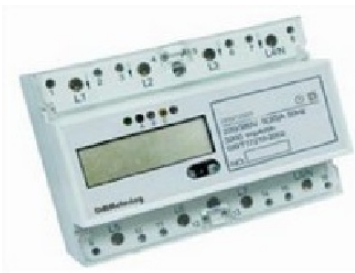
Måler Direkte Digital PRO1250D 3+N 100A 400V TN