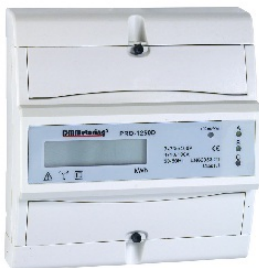
Måler Direkte Digital PRO1250D 3 POL 100A 230V IT