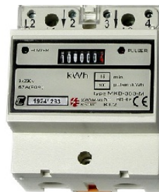
MÅLER MKB363M 3-fas Mekanisk Telleverk 63Amp