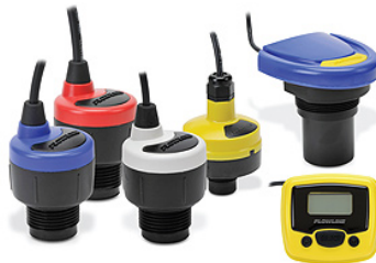
Vannstandsmålere med ultralyd.

Produktnavn: EchoPod DS14 Produsentnavn: Flowline Type: Ultralyd