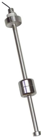
Vannstandsmåler. Foto: Madison

Produktnavn: Model C4652 Produsentnavn: Madison Type: Flottørmåler