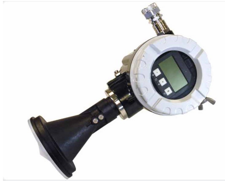
Vannstandsmåler med radar.

Produktnavn: H-3611-S SDI-12 Produsentnavn: Waterlog Type: Radarsensor