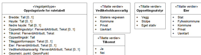
Figur 2: UML-skjema tillatte verdier