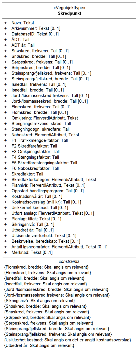
Figur 1: UML-skjema med betingelser