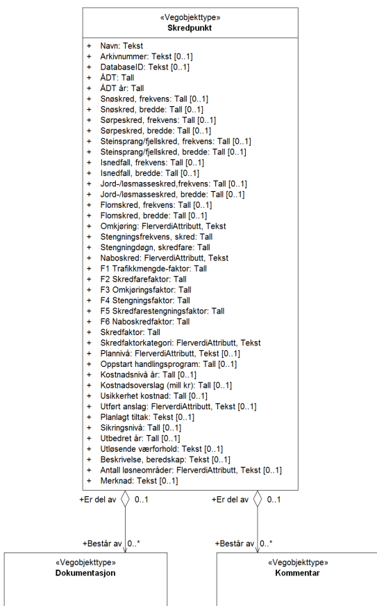
Figur 3: UML-skjema med assosiasjoner