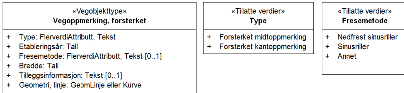
Figur 2:UML-skjema tillatte verdier