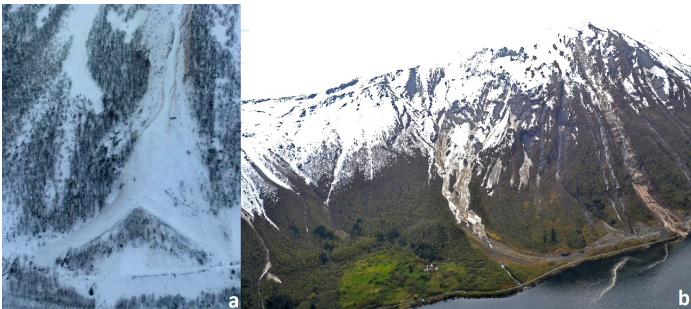
a) Ledevoll bygd som plog b) Ledevoll

Ledevoller brukes til å styre skredbevegelsen i utløpsområdet. Ledevoller kan også bygges som en plog og styre skredet i flere retninger.