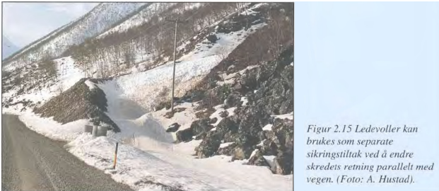
Figur 2.15 Ledevoller kan brukes som separate sikringstiltak ved å endre skredets retning parallelt med vegen.

Adkomst : Hjullaster Brekke fot : 3,5 meter Brekke krone : 0.5 meter Bruksområde : Skredsikring, ledevoll Byggeår : 1976 Helning, gjsn : 45 grader Helning, maks : 60 grader Høyde, gjsn : 1.5 meter Høyde, maks : 2.5 meter Lengde : 50 meter Materialtype : Jord