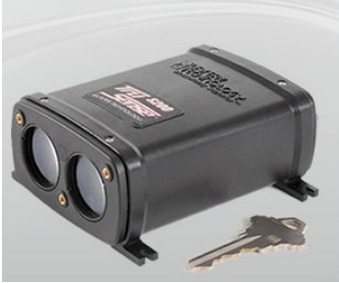
Vannstandsmåler med laser.

Produktnavn: TruSense S200 Produsentnavn: Laser Technology Type: Laser