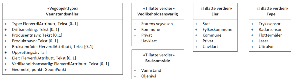
Figur 2:UML-skjema tillatte verdier