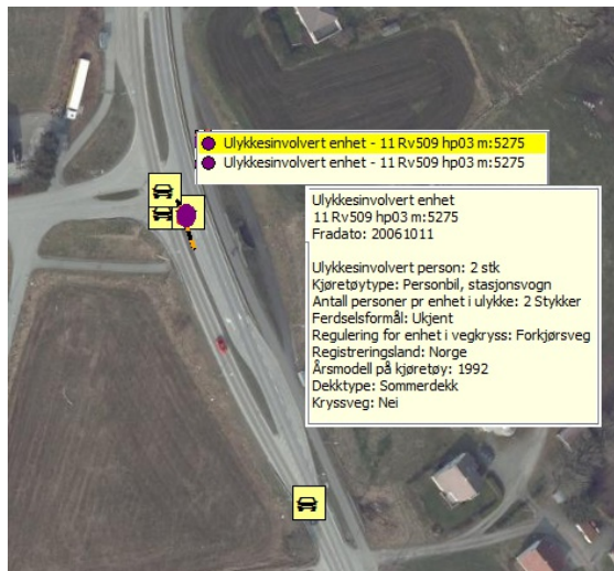
Figur 3: Data for ulykke med 2 ulykkesinnvolverte enheter

Eksemplet viser data fra en trafikkulykke med to enheter involvert i ulykken. Vi ser her at det er to personer involvert i den ene bilen, og disse vil da finnes igjen som ulykkesinnvolvert person.