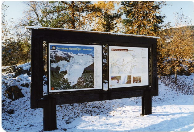
Stativ for turistinno i Hardanger.

Antall infoplater : 2 Belyst : Nei Fundamentering: Stolpefundament Materialtype: Metall Overflatebehandling: Ubehandlet Plexiglass utenpå infoplater: Nei Stedsangivelse: Stegabakken Tak: Nei