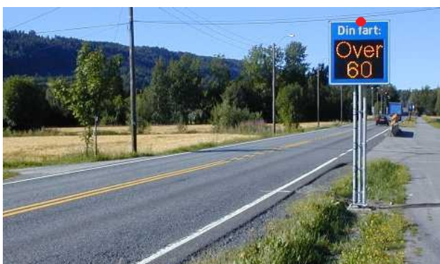
Fartstavle måles inn i senter topp tavle som vist her med rød prikk

Stasjonering : Fast Type måling : Sløyfe Produksjonsår : 2008 (opsjonell) Produktnavn : Fartstavle med Datarec 7 Driftsmerking : Tavle3