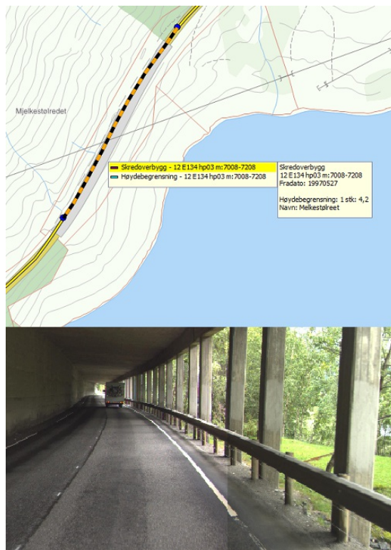
Figur 3: Eksempel på skredoverbygg

Navn: Mjølkestøret Brutus_id: xxx Lengde: 200 Type: Skredoverbygg, m/fjellforank.,åpen frontvegg, m/bakvegg