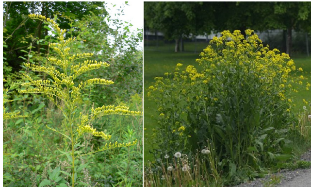
Kanadagullris og russekål

Artsnavn : Kanadagullris & / Russekål Areal : 12/ 20 Antall individ : - Bestandsbredde : 2 /3 Forekomst fortsetter på naboeiendom : : &9980:Nei & / &9980:Ja & Forekomst nr : 8 / 4 Bekjempelsesgrad : &9982:Bekjempes & / &9982:Bekjempes & Tetthet : &9119:Tett bestand & / &9119:Tett bestand & Bekjempelse, type : &9977:Kantklipp & &9977:Kantklipp &