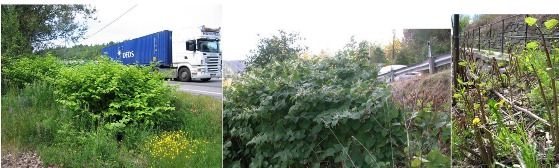
Park- og hybridlirekne.

Park- og hybridlirekne (Fallopia japonica)