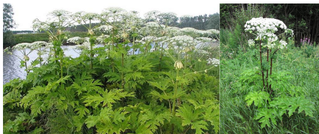
Tromsøpalme og kjempebjørnekjeks.

Artsnavn : Tromsøpalme / Kjempebjørnekjeks Areal : 8 / 1 Antall individ : 8 / 1 Bestandsbredde : 3 / 1 Forekomst fortsetter på naboeiendom : Ja / Nei Forekomst nr : 7 / 2 Bekjempelsesgrad : Bekjempes / Bekjempes Tetthet : Tett bestand / Få Bekjempelse, type : Kantklipp / Kantklipp Registrert dato : 20140815