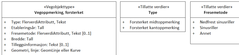
Figur 2:UML-skjema tillatte verdier