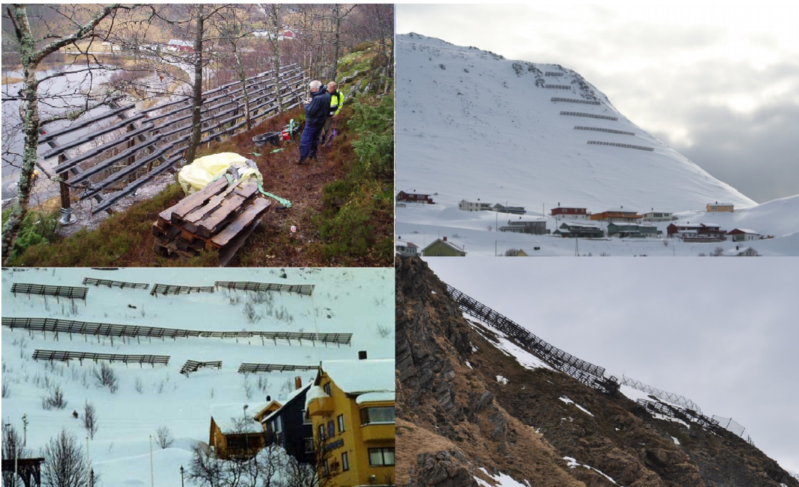
Eksempler på støtteforbygninger.

Adkomst: Kran/Til forts/Kran/Til fots Totalt antall: 6/84/68/36 Antall rader: 1/6/4/5 Byggeår: 2004/1997/2003/2005