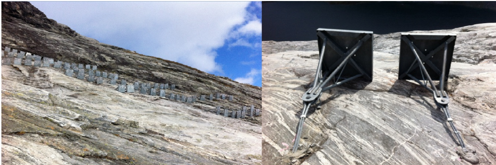
Eksempler på bruk av snøanker.

Adkomst: Helikopter Totalt antall: 120 Antall rader: 8 Byggeår: 2004 Sikra areal: 3200 m 2 Høyde sikringselement: 1,2 m