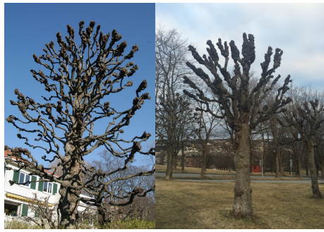
Knutekollede trær.

Krav om ytterligere oppfølging : Ja Krone- og stammestruktur : 2-Middels Kronediameter : 2 Løvfellende/vintergrønne : Løvfellende Plantetidspunkt : 1943 Registreringsdato : 20160312 Stammediameter : 18 cm Treslag, botanisk navn : Tilia cordata Treslag, norsk navn : Lind Type/form : Knutekollet Type/gruppering : Trerekke Utviklingsfase : Vekstfase Eier : Privat Vedlikeholdsansvarlig : Statens vegvesen