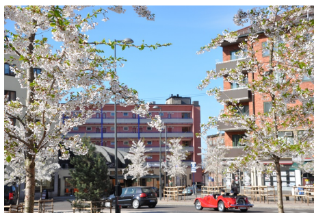
Hegg i blomstring.

Antall : : 1 stk Høyde : 4 m Treslag, botanisk navn : Prunus padus Treslag, norsk navn : Hegg Type/gruppering : Frittstående tre Kronediameter : 2 m Løvfellende/vintergrønne : Løvfellende Plantetidspunkt : 2006 Stammediameter : 18 (cm) Eier : Kommune Vedlikeholdsansvarlig : Kommune Krav om ytterligere oppfølging : Ja Krone- og stammestruktur : 2-Middels Registreringsdato : 20150612 Utviklingsfase : Vekstfase