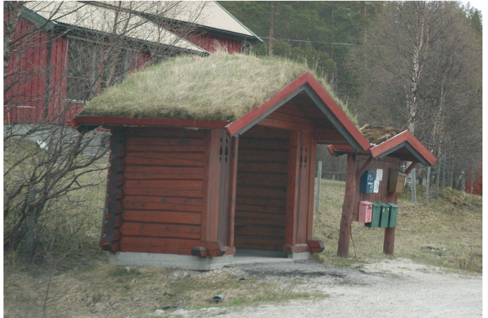
Leskur i tre.

Glassflate markert: Nei Areal tilpasset rullestol: Nei Innvendig belysning: Nei Materialtype: Tre Reklameavtale: Nei Sittemulighet: Nei