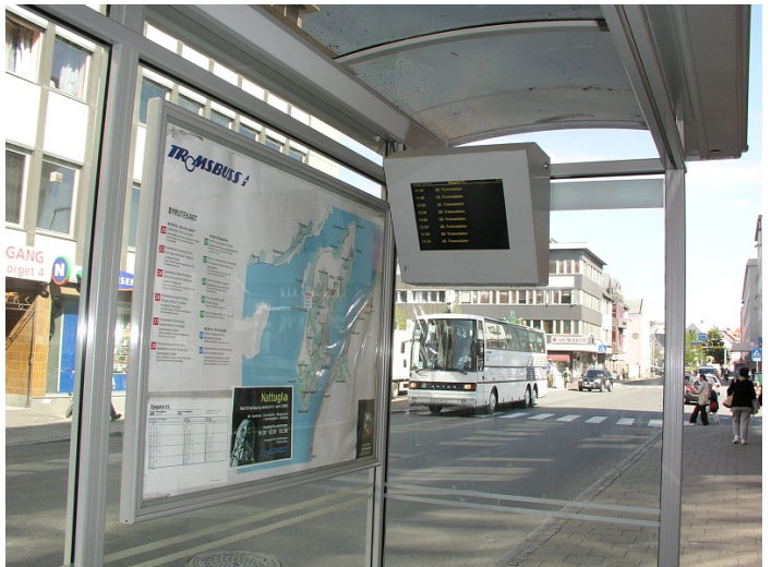
Leskur med sanntidsinformasjon: Foto Bente Skogdal

Glassflate markert: Nei Areal tilpasset rullestol: Nei Innvendig belysning: Ja Materialtype: Pleksiglass Reklameavtale: Nei Sittemulighet: Nei