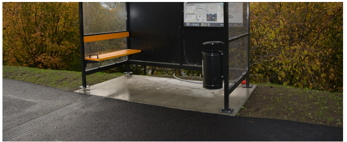
Moderne leskur.

Glassflate markert: Ja Areal tilpasset rullestol: Ja Innvendig belysning: Ja Materialtype: Pleksiglass Reklameavtale: Nei Sittemulighet: Ja