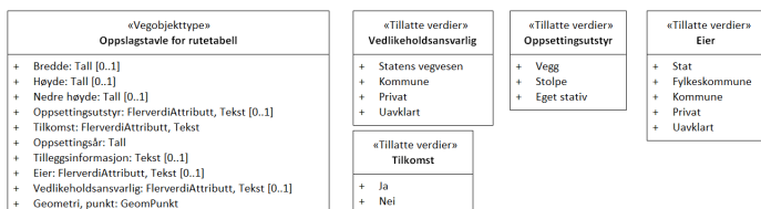
Figur 2: UML-skjema tillatte verdier