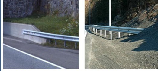
Sideforankring i mur og jordskjæring