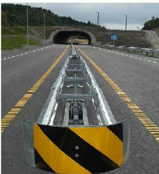
Avslutning i støtpute (Støtpute er eget objekt i Datakatalogen)