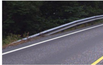
Nedføring i bakken med og uten utsvinging