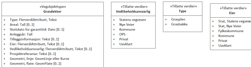
Figur 2: UML-skjema tillatte verdier