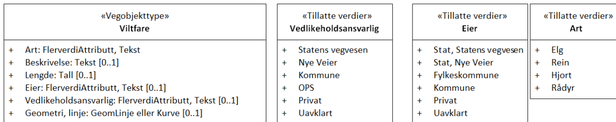
Figur 2:UML-skjema tillatte verdier