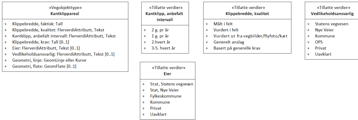
Figur 2: UML-skjema tillatte verdier