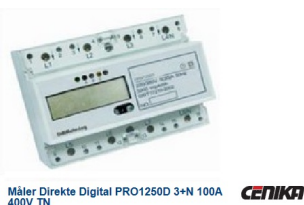
Måler Direkte Digital PRO1250D 3+N 100A 400V TN CENIKA