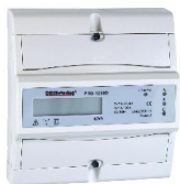
Måler Direkte Digital PRO1250D 3 POL 100A 230V IT CENIKA