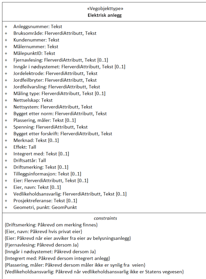
Figur 1: UML-skjema med betingelser