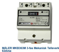
MÅLER MKB363M 3-fas Mekanisk Telleverk 63Amp efa