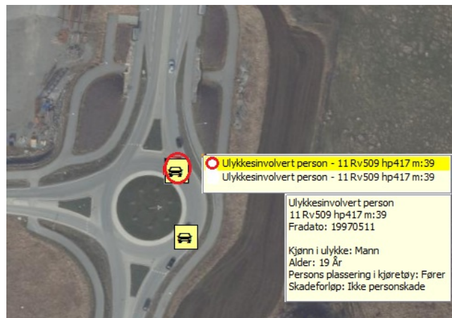
Figur 3: Data for en ulykkesinnvolvert person

Her vises data for den ene av to ulykkesinnvolverte personer i en ulykkesinnvolvert enhet