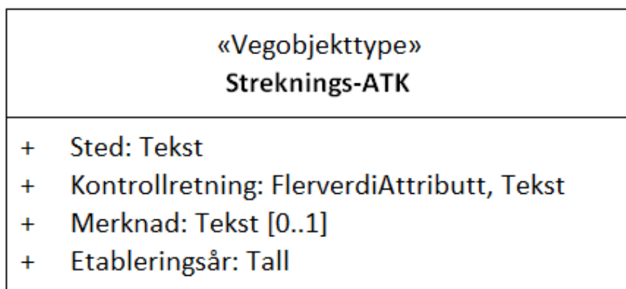
Figur 1: UML-skjema