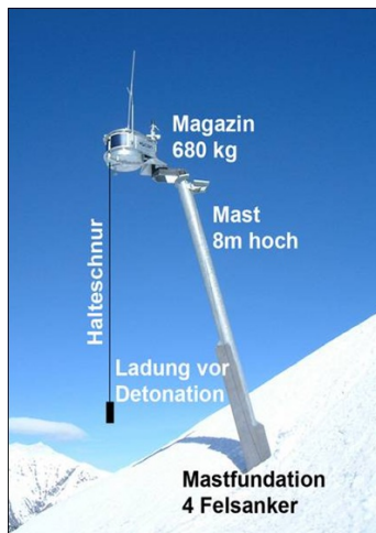
Figur 3: Skredutløsning med Wyssentårn.

Adkomst: Helikopter Antall enheter: 1 Byggeår: 2008 Type: Wyssentårn