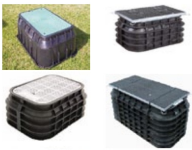
Figur 3: Bilder viser eksempler på trekkekummer

Eksempler på noen utforminger av Trekkekum