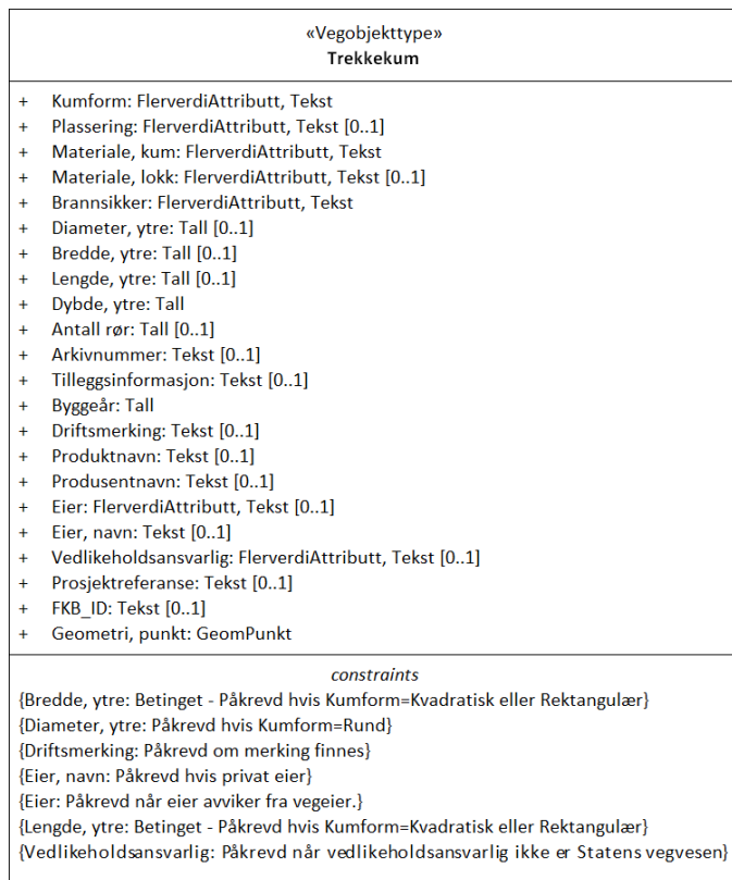
Figur 1: UML-skjema for Trekkeikum